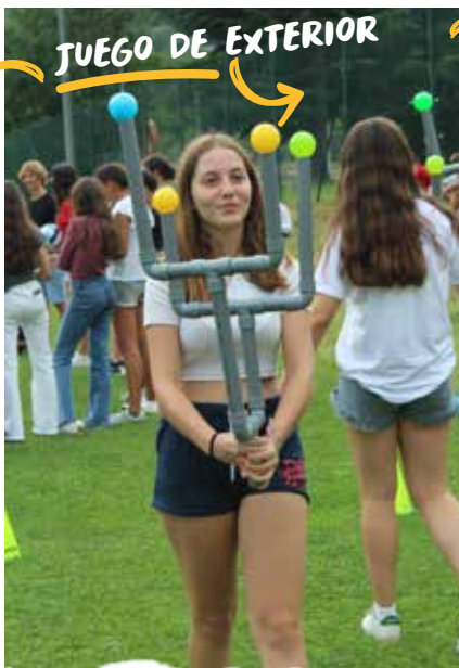
JUEGO DE EXTERIOR