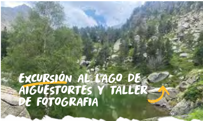
EXCURSIÓN AL LAGO DE AIGÜESTORTES Y TALLER DE FOTOGRAFIA