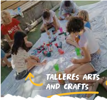
TALLERES ARTS AND CRAFTS

Cada tarde una actividad, taller o juego diferente