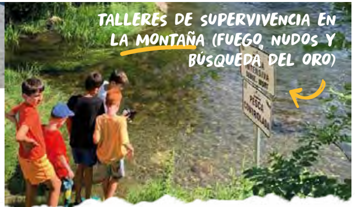
TALLERES DE SUPERVIVENCIA EN LA MONTAÑA (FUEGO, NUDOS Y BÚSQUEDA DEL ORO)